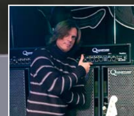
John Levén, Europe

Der typische 15" Charakter mit erdigen Bässen und „holzigen“ Mitten macht die Box zum idealen Partner der QS 410 oder QS 210 • 1 x 15" Neod.- Speaker • 300 Watt • 8 Ohm • 670 x 600 x 405 mm, 23 kg